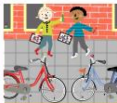
Kijk je fiets na

"We leerden eerst regels over oversteken. Op een parcours moesten we laten zien dat we veilig konden oversteken. Daarna maakten we een lange wandeling door de wijk. Iedereen vertelde waar hij speelde. Samen met een meneer van de gemeente keken we of het daar veilig was. Ik ga nu toch liever op het veldje spelen dan in onze straat. Zeker als er een goaltje bij komt. Dat had de meneer beloofd. Op het einde maakte ons groepje een kwartspel over veilig spelen."