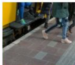
Reizen met het ov

"We mochten een stad uitzoeken in Nederland. We stippelden een route uit naar die stad met de fiets en met het OV. Met de fiets heb je wel 2 dagen nodig. We herhaalden alle verkeersregels en leerden er nog meer bij. Over rotondes en signalen. Daarna moesten we op voor het echte verkeersexamen. Aan het einde van het project maakte ons groepje een voorlichtingsfilm over rotondes. Daarvoor interviewden we mensen op de rotonde bij de school."