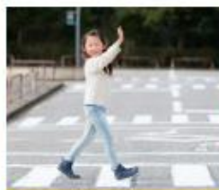
Steek over bij een zebra pad

Groep 8 maakte een loopparcours voor ons op het schoolplein. We maakten zelf verkeersborden en oefenden met oversteken. Daar kregen we een diploma voor."