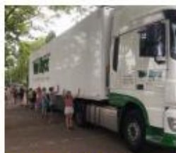
Waar zit de dode hoek?

"Er stond een grote vrachtwagen voor de school. We oefenden met de dode hoek. Die is best groot. De vrachtwagenchauffeur vertelde hoe lastig dat voor hem is. Daarna mocht elk groepje een kruispunt in de wijk onderzoeken. Wat is veilig en wat niet? We maakten een top 3 van gevaarlijke en een top 3 van veilige kruispunten in onze buurt. Tot slot liet ik op het fietsparcours op het schoolplein zien dat ik alle fietsregels wist."