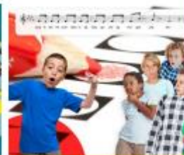
Lied: Stem op mij!