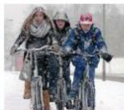
Fietsen voor gevorderden