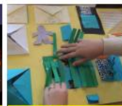
Maak een lapbook