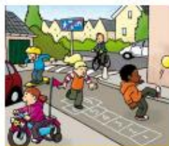
Hoe speel je veilig buiten?