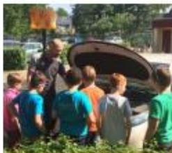
Een banenmarkt op school

"Elke week kwam er een vader of moeder vertellen over hun beroep. We mochten ook een keer mee naar een werkplaats. Ik wist niet dat er zoveel beroepen waren. Onze beroepenwand was te klein voor al onze informatie. Ons groepje heeft ook een tableau vivant gemaakt over beroepen uit de middeleeuwen. Beroepen die nu heel anders zijn."