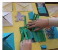
Maak een lapbook