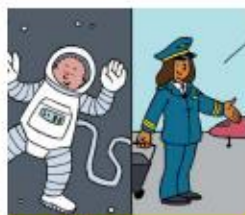
Leer over beroepen