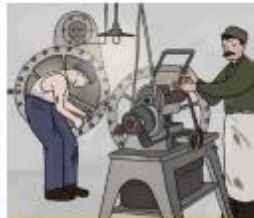
Werken toen en nu