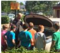
Een banenmarkt op school

"Elke week kwam er een vader of moeder vertellen over hun beroep. We mochten ook een keer mee naar een werkplaats. Ik wist niet dat er zoveel beroepen waren. Onze beroepenwand was te klein voor al onze informatie. Ons groepje heeft ook een tableau vivant gemaakt over beroepen uit de middeleeuwen. Beroepen die nu heel anders zijn."