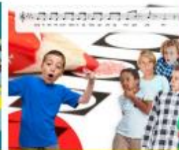
Lied: Stem op mij!