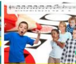
Lied: Stem op mij!