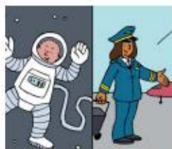
Leer over beroepen