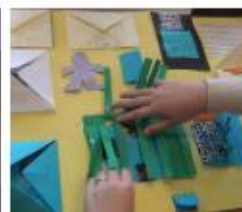
Maak een lapbook