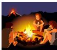
Van vuur tot lamp

"Ik heb een lapbook gemaakt over uitvindingen. Over de fiets en de gloeilamp. We mochten zelf vliegtuigjes vouwen en kijken wie het verste kwam. We hebben op het einde een nieuw muziekinstrument uitgevonden: de triool. Een muzikant kwam ons helpen. Het was best lastig om mooie klanken uit te vinden."