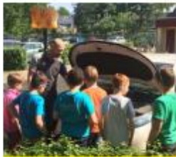
Een banenmarkt op school

"Elke week kwam er een vader of moeder vertellen over hun beroep. We mochten ook een keer mee naar een werkplaats. Ik wist niet dat er zoveel beroepen waren. Onze beroepenwand was te klein voor al onze informatie. Ons groepje heeft ook een tableau vivant gemaakt over beroepen uit de middeleeuwen. Beroepen die nu heel anders zijn."