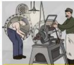
Werken toen en nu