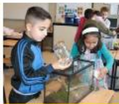
Maak een terrarium