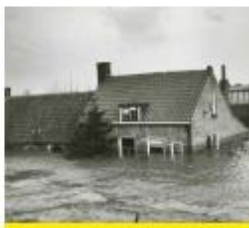
De watersnoodramp in 1953

"We hebben geleerd dat Nederland een echt waterland is. Wij wonen in laag Nederland. We hebben op een dijk gelopen met een mevrouw van het waterschap. Zij legde uit waarom dijken zo belangrijk zijn. We hebben er een persbericht over gemaakt. Ons verhaal kwam in de plaatselijke krant."