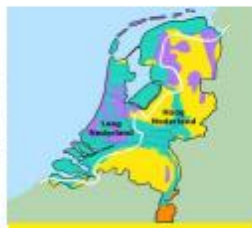
Hoog en laag Nederland