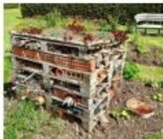
Een insectenhotel maken

Naast het hotel hebben we een voerplaats voor vogels gemaakt. Op het laatst heeft iedereen een dier uitgezocht om over te vertellen. Ik heb verteld over de hooiwagen."