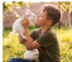
Hoe verzorg je een konijn?

"We hebben samen kikkervisjes gevangen en verzorgd. Ze kregen eerst pootjes aan de achterkant. We hebben geleerd over vogels in Nederland. We hebben samen met IVN vogels gespot. Ik ken nu wel 10 vogels. Ik heb er een boekje over gemaakt."