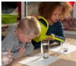
Houd een weerkalender bij