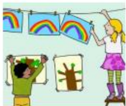
Maak een tentoonstelling

"Het was herfst. We hebben wind, zon en regen gevangen. Dat kan echt. We hebben ook een regenboog gemaakt met een glas water en ook een regenboog geschilderd. Op het einde hebben we een tentoonstelling gemaakt over de herfst. Alle papa's en mama's kwamen kijken."