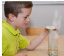
Maak een wolk in een pot

We hebben de temperatuur gemeten en een windwijzer en regenmeter gemaakt. Ik mocht ook het weer presenteren voor de camera. Het was net echt."