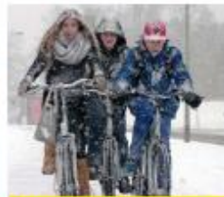
Fietsen voor gevorderden