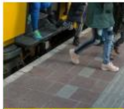
Reizen met het ov

"We mochten een stad uitzoeken in Nederland. We stippelden een route uit naar die stad met de fiets en met het OV. Met de fiets heb je wel 2 dagen nodig. We herhaalden alle verkeersregels en leerden er nog meer bij. Over rotondes en signalen. Daarna moesten we op voor het echte verkeersexamen. Aan het einde van het project maakte ons groepje een voorlichtingsfilm over rotondes. Daarvoor interviewden we mensen op de rotonde bij de school."