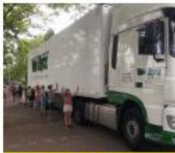
Waar zit de dode hoek?

"Er stond een grote vrachtwagen voor de school. We oefenden met de dode hoek. Die is best groot. De vrachtwagenchauffeur vertelde hoe lastig dat voor hem is. Daarna mocht elk groepje een kruispunt in de wijk onderzoeken. Wat is veilig en wat niet? We maakten een top 3 van gevaarlijke en een top 3 van veilige kruispunten in onze buurt. Tot slot liet ik op het fietsparcours op het schoolplein zien dat ik alle fietsregels wist."