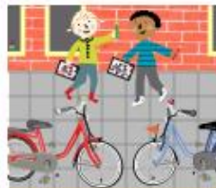
Kijk je fiets na

"We leerden eerst regels over oversteken. Op een parcours moesten we laten zien dat we veilig konden oversteken. Daarna maakten we een lange wandeling door de wijk. Iedereen vertelde waar hij speelde. Samen met een meneer van de gemeente keken we of het daar veilig was. Ik ga nu toch liever op het veldje spelen dan in onze straat. Zeker als er een goaltje bij komt. Dat had de meneer beloofd. Op het einde maakte ons groepje een kwartspel over veilig spelen."