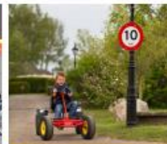
Leer over verkeersborden