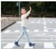
Steek over bij een zebra pad

Groep 8 maakte een loopparcours voor ons op het schoolplein. We maakten zelf verkeersborden en oefenden met oversteken. Daar kregen we een diploma voor."