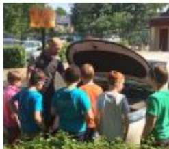
Een banenmarkt op school

"Elke week kwam er een vader of moeder vertellen over hun beroep. We mochten ook een keer mee naar een werkplaats. Ik wist niet dat er zoveel beroepen waren. Onze beroepenwand was te klein voor al onze informatie. Ons groepje heeft ook een tableau vivant gemaakt over beroepen uit de middeleeuwen. Beroepen die nu heel anders zijn."