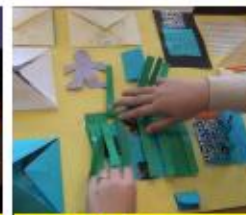
Maak een lapbook