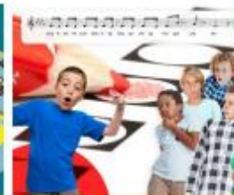
Lied: Stem op mij!