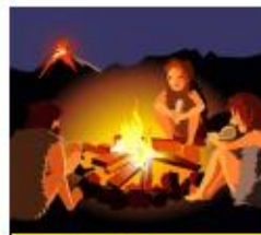
Van vuur tot lamp

"Ik heb een lapbook gemaakt over uitvindingen. Over de fiets en de gloeilamp. We mochten zelf vliegtuigjes vouwen en kijken wie het verste kwam. We hebben op het einde een nieuw muziekinstrument uitgevonden: de triool. Een muzikant kwam ons helpen. Het was best lastig om mooie klanken uit te vinden."