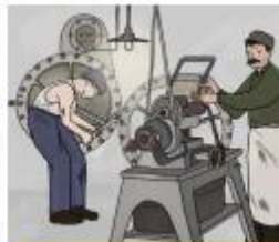
Werken toen en nu