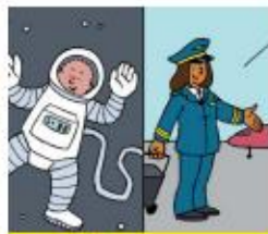
Leer over beroepen