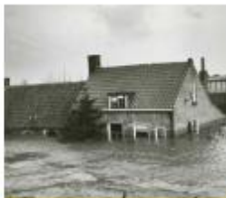
De watersnoodramp in 1953

"We hebben geleerd dat Nederland een echt waterland is. Wij wonen in laag Nederland. We hebben op een dijk gelopen met een mevrouw van het waterschap. Zij legde uit waarom dijken zo belangrijk zijn. We hebben er een persbericht over gemaakt. Ons verhaal kwam in de plaatselijke krant."