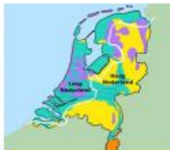
Hoog en laag Nederland