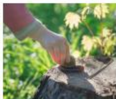
Hoe pak je een slak op?