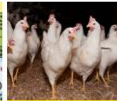
De kip als productiedier