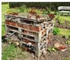
Een insectenhotel maken

Naast het hotel hebben we een voerplaats voor vogels gemaakt. Op het laatst heeft iedereen een dier uitgezocht om over te vertellen. Ik heb verteld over de hooiwagen."