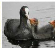
Vogels in Nederland