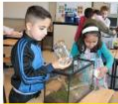
Maak een terrarium