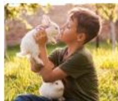
Hoe verzorg je een konijn?

"We hebben samen kikkervisjes gevangen en verzorgd. Ze kregen eerst pootjes aan de achterkant. We hebben geleerd over vogels in Nederland. We hebben samen met IVN vogels gespot. Ik ken nu wel 10 vogels. Ik heb er een boekje over gemaakt."